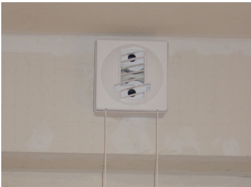
Abb. 1: Abluftventil verstellbar durch Schnurzug (Typ BAP-VM von ALDES)

Einige Hersteller bieten Abluftventile an, bei denen über Schnurzug oder elektrisch zwei Ventilstellungen geschaltet werden können. Diese Ventile können vor allem bei zentralen Abluftanlagen mit differenzdruckgesteuertem Ventilator eingesetzt werden und erlauben somit eine Nutzerseitige Umschaltung zwischen Normallüftung und Stoßlüftung. Außerdem stehen selbstregulierende Abluftventile zur Verfügung, die weitgehend unabhängig von den Druckverhältnissen im Kanalnetz einen konstanten Abluftvolumenstrom sicherstellen.