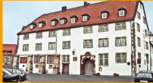
Gebäudetyp: Justizvollzugsanstalt (Sanierung) Größe: 27.468 m 2