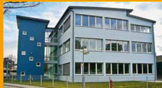
Gebäudetyp (zu Wangen): Bürogebäude (Neubau) Größe: 1.089,16 m 2