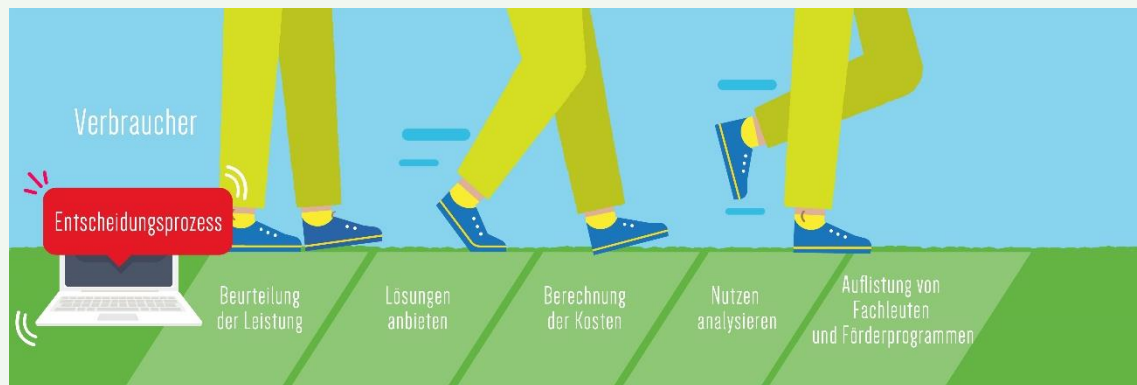
HARP a , Online Tool Architektur